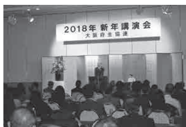
126人が参加しました。