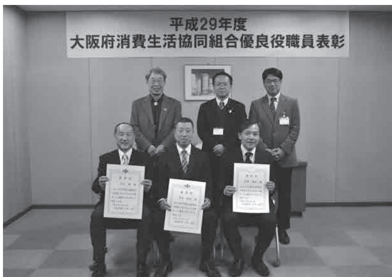
後列左より惣宇利会長理事(大阪府生協連)、江島次長(大阪府府民文化部)、長澤課長(大阪府男女参画・府民協働課) 前列左より北辻様、寺内様、大阪府民共済の受賞者